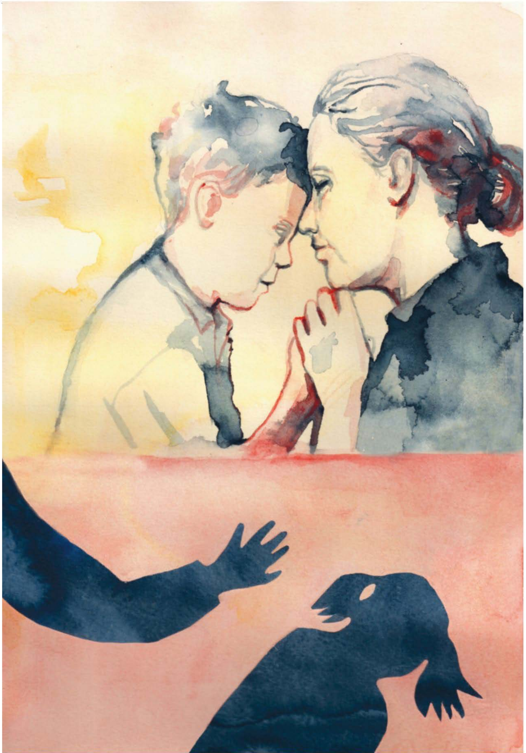
Illustration: Mia Fernau