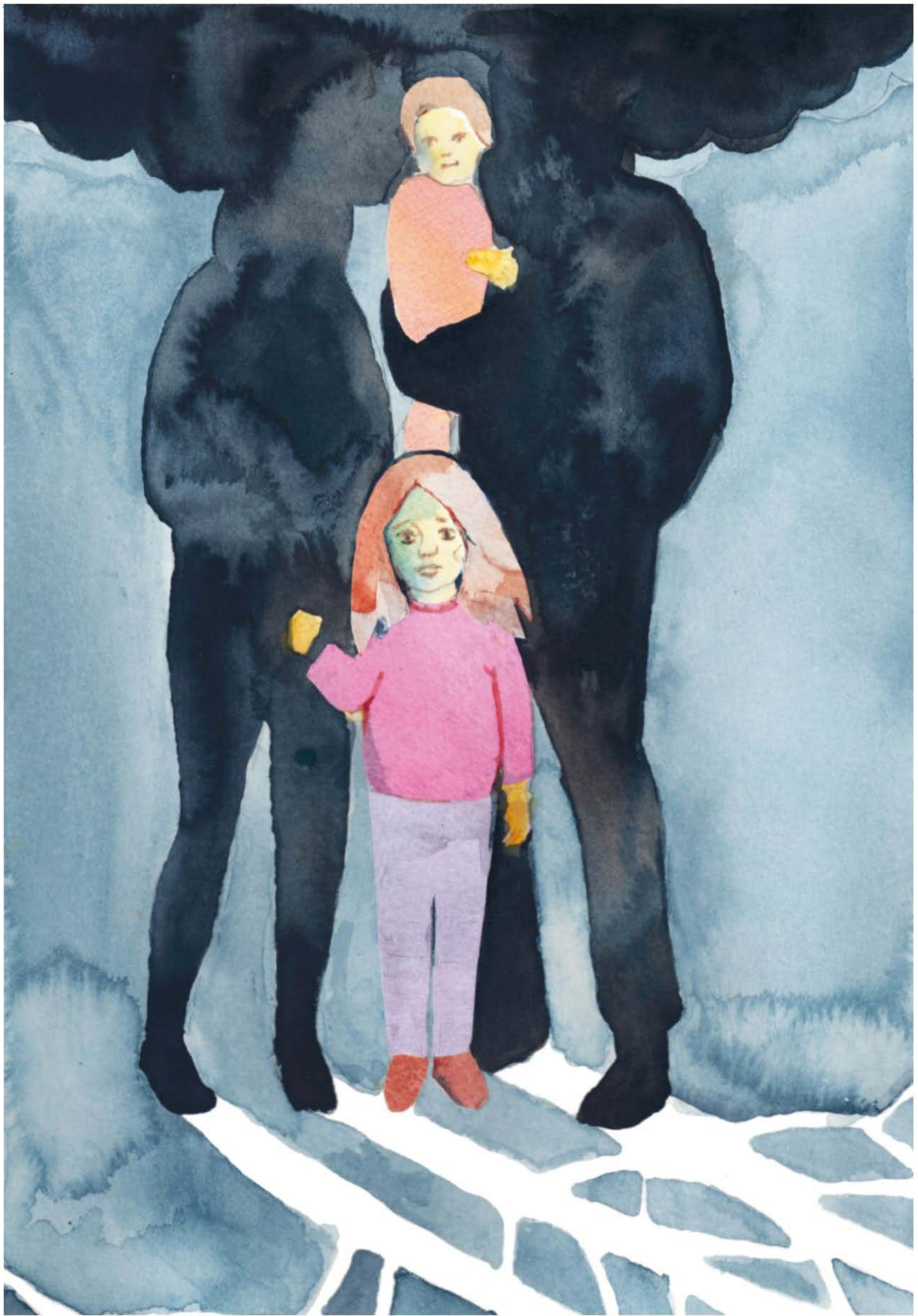
Illustration: Mia Fernau