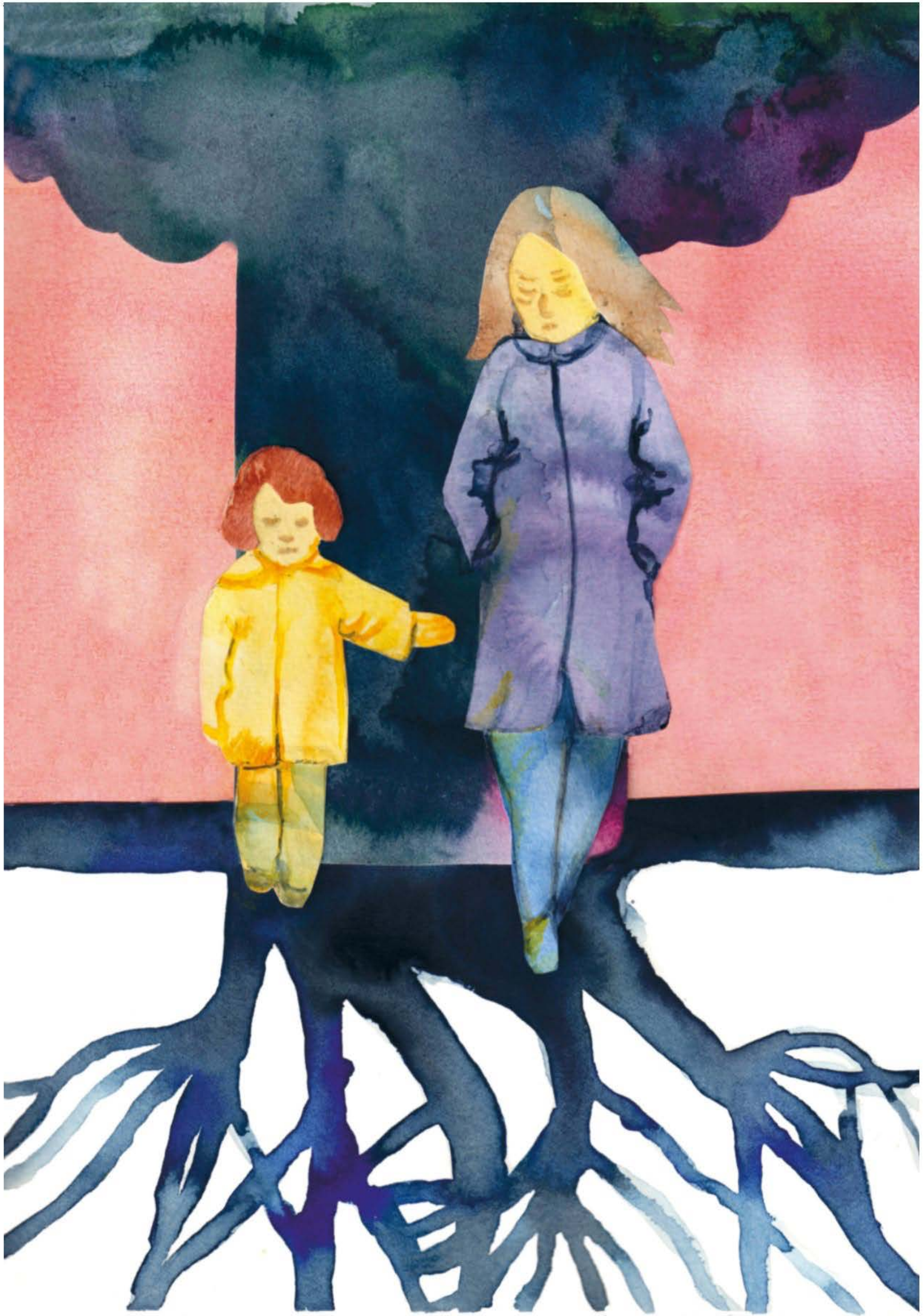
Illustration: Mia Fernau