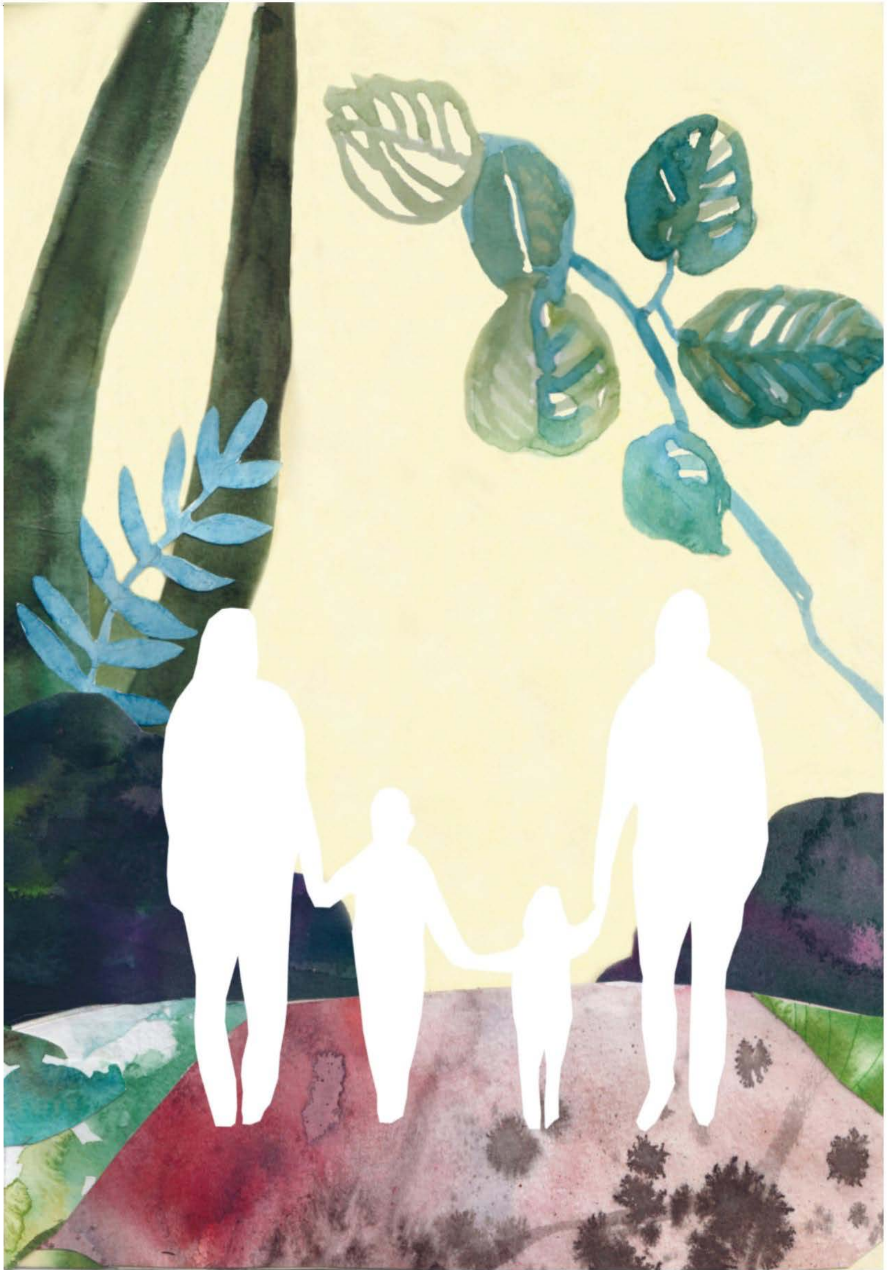
Illustration: Mia Fernau