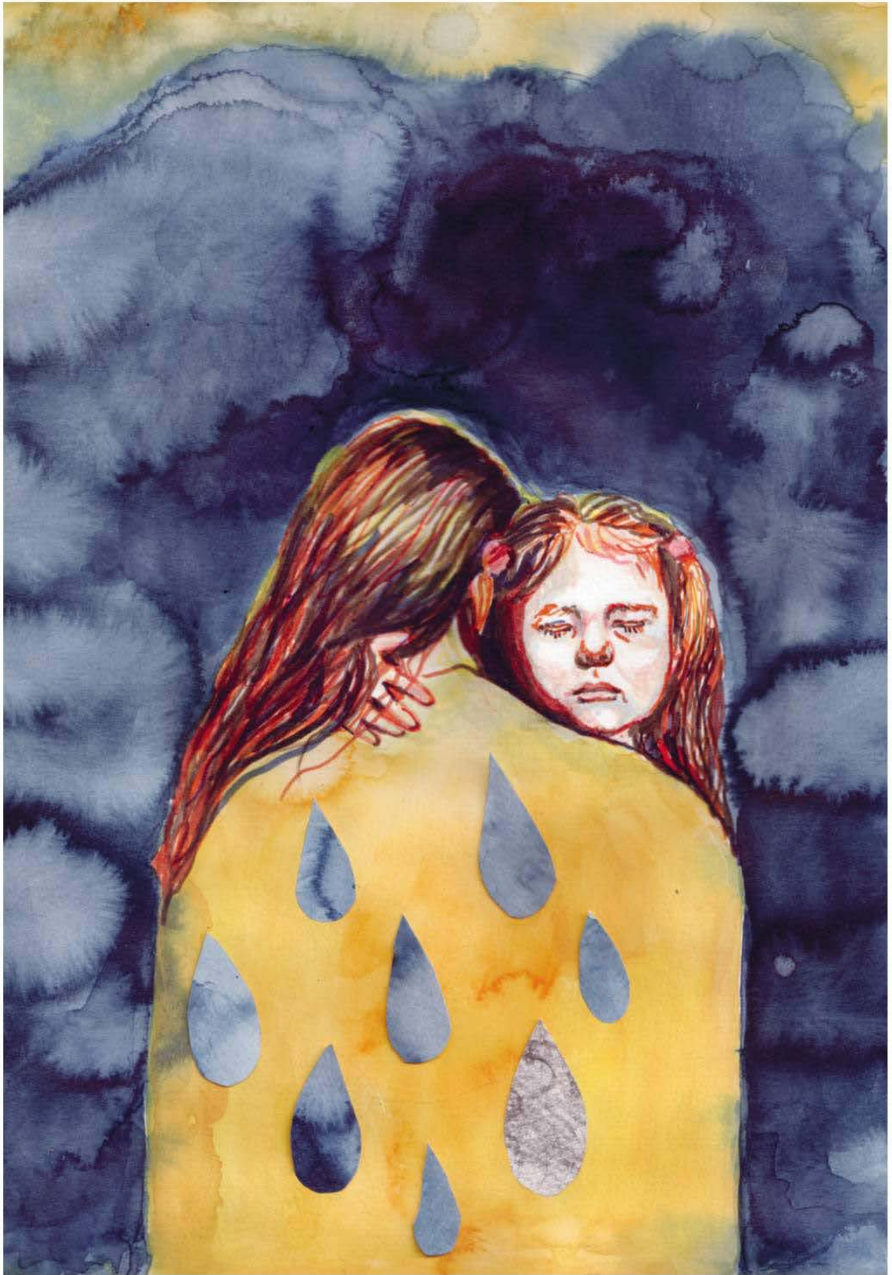
Illustration: Mia Fernau