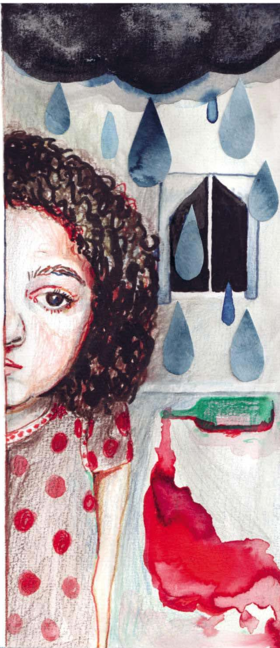
Illustration: Mia Fernau