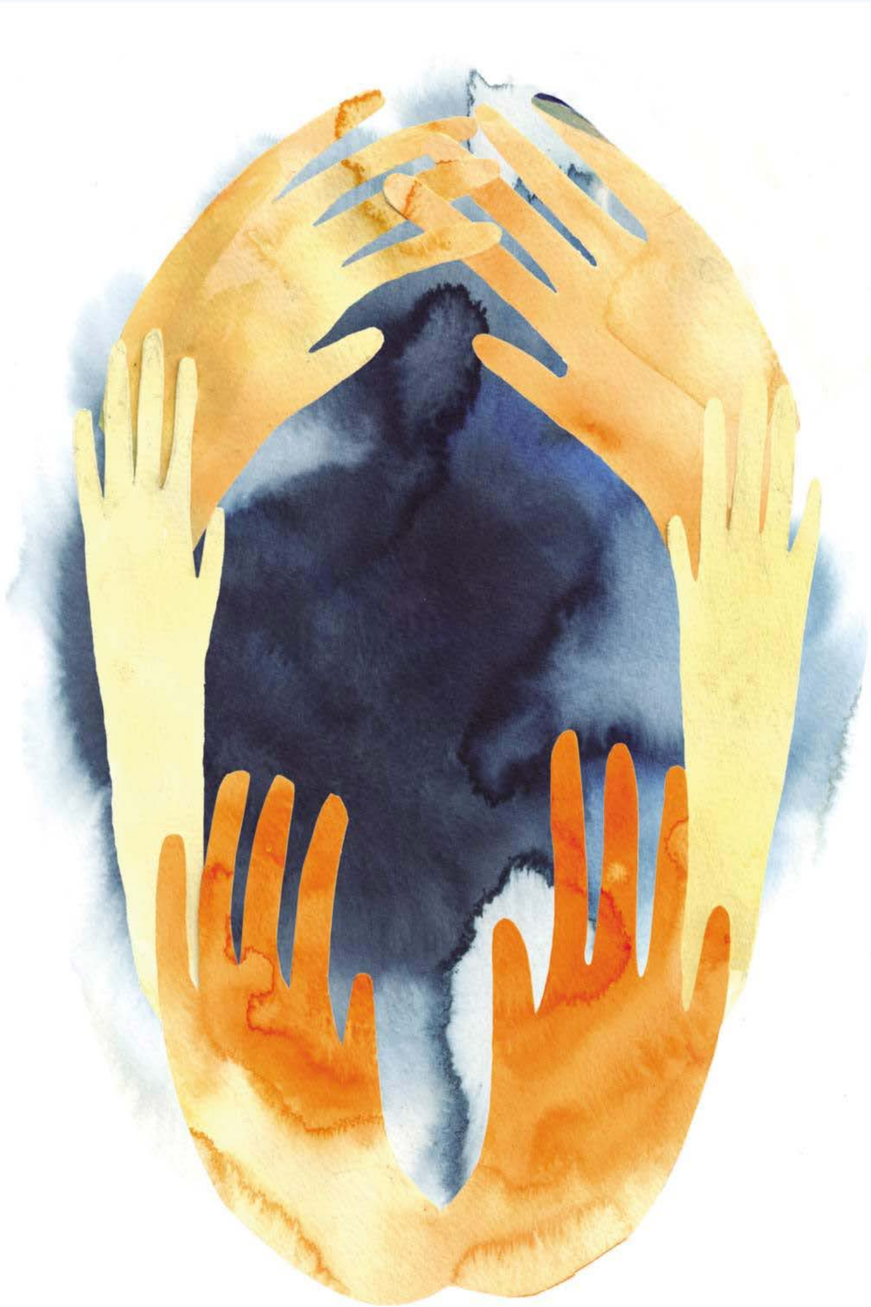
Illustration: Mia Fernau