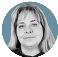
Karin Flyckt

Det ska sägas att kommunerna tillgodoser mångas behov av stöd, men rapporten visar att tillgången till insatser är ojämlig beroende på vilken kommun personen bor i. Skillnaderna blir särskilt tydliga då någon flyttat och