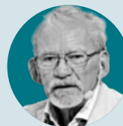
”Sverige har blivit ett fängelseland i stil med USA” SVEN-ERIC LIEDMAN