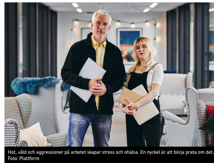
Hot, våld och aggressioner på arbetet skapar stress och ohälsa. En nyckel är att börja prata om det.

När yrkesgrupper inom välfärden möter hot, våld och aggressioner på sina arbetsplatser har vi allvarliga problem. Signalen är tydlig när kommuner och regioner nu växlar upp: Detta är en verklighet vi måste se, prata om och hantera tillsammans!