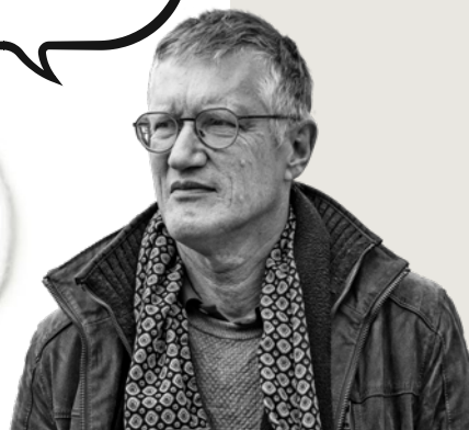
Källor: SCB, UR, riksdagen.se, regeringen.se Foto: Wikimedia CC/Frankie Fouganthin, Getty Images

→ stora och inte anses rimliga och rättvisa kan det bli problem. Det måste finnas en balans, och här kommer diskussioner in kring hur stora skillnader vi ska ha och vilka skatter som ska sänkas och höjas. Det är en svår fråga då det aldrig kommer att finnas någon konsensus kring detta.