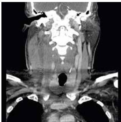
FALLBESKRIVNING Om Lemierres syndrom, som drabbar främst yngre. Sidan 403

167 hade svarat den 18 februari kl 11.00.