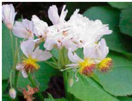
KULTUR Växten rumsblind (Sparrmannia africana) är uppkallad efter Anders Sparrman, en av Linnés lärjungar. Sidan 103

475 hade svarat den 14 januari kl 11.00.