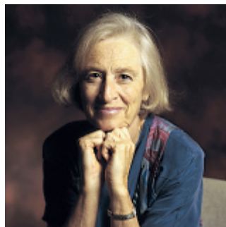
Barbara Starfield (1932–2011), har kallats en ikon inom allmänmedicinen.

Här refereras en rad studier, från olika delar av världen, som visar på samband mellan utbyggd primärvård och folkhälsa, och några som visar att subspecialiserad sjukdomsorienterad vård kan vara dyr och ineffektiv. Ett exempel är den thailändska vårdreformen med etablering av en vårdcentral i varje by som ledde till minskad barnadödlighet, medan motsatt utveckling skedde i Indonesien. Ett annat exempel är den kanadensiska utvecklingen av primärvård som gav minskad dödlighet i bröstcancer, speciellt i socioekonomiskt svaga grupper, jämfört med utveck-