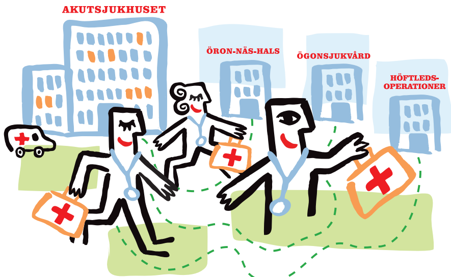
Illustration: Cecilia Waxberg

Regeringen avser att med ekonomiska incitament locka landsting/regioner att införa vårdval för specialistvård. Planerad vård lyfts ut från akutsjukhus. AKTUELLT Sidan 1350