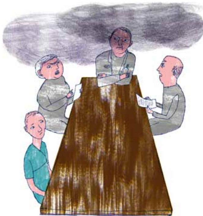
PÅ TEAMKONFERENS: »Tänk att de idioterna inte ens kan skriva en remiss så man begriper!«

Och hon återkommer till att introduktionen av nyan-