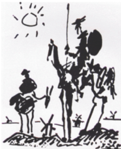
KULTUR Don Quijote – en bok för läkare? Sidan 2986