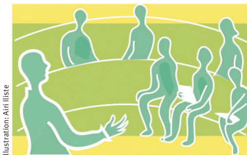
Illustration: Airi Ilviste