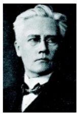
HERMAN LUNDBORG Professor och chef för Statens Rasbiologiska Institut i Uppsala. En av initiativtagarna till Riksföreningen Sverige-Tyskland som bildades i Lund 1937.