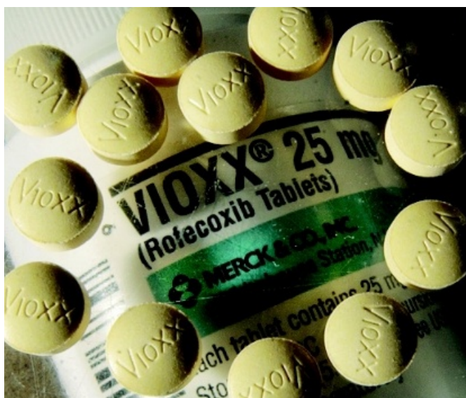
Läkemedelsföretaget Merck & Co, som gjorde Vioxx-studien, hävdar att de vetenskapliga syftena övervägde. Men de vetenskapliga dokumenten som nu granskas av forskare säger något annat.

– Jag tycker att det är olyckligt om folk inte förstår att vi är kommersiella företag. Vi ska tjäna pengar och då måste vi få