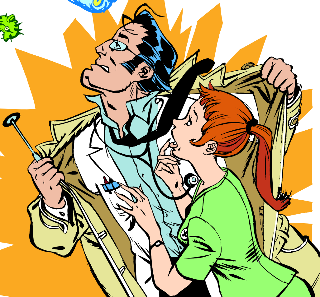
ILLUSTRATION: ANDERS WESTERBERG

»... kände jag mig som den super- hjärte jag alltid velat vara ... Jag hade ingen mantel som Läderlappen eller Stålmannen. Jag hade rocken. Mina speciella vapen var stetoskopet och reflexhammaren.«