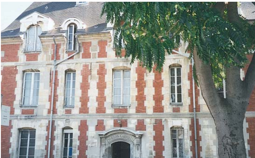
Pavillon Gabrielle i Paris där Strindberg vårdades för psoriasisexsem på händerna.