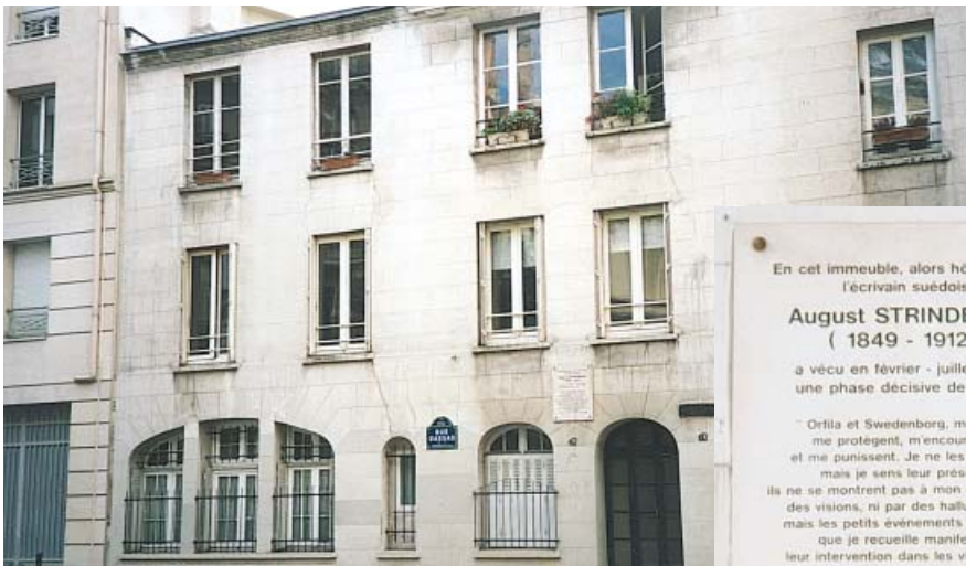
Hotel Orfila i Paris där Strindberg bodde 1886 och där hans »Infernokris« nådde sin kulmen.