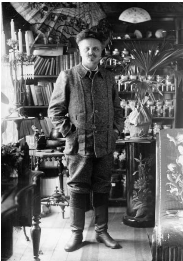
August Strindberg, Lund i 1897.

»Sålunda företer min läkares boning anblicken av ett buddhaistiskt kloster. Byggnadens fyra flyglar en våning höga, innesluta en fyrkantig gård, och mitt på denna står ett uthus i kupolform, en efterhärmining av Tamerlans grav i Samarkand ... Detta kloster med oräkneligt många rum är bebott av allenast en mänsklig varelse, distriktets lasarettsläkare. Änkling, enstöring, oberoende har han gått igenom livets hårda skola och ser ner på människorna med det starka och förnåma förakt, som härflyter ur en