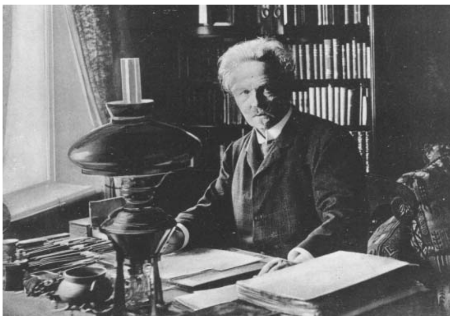
August Strindberg 1911 i Stockholm.