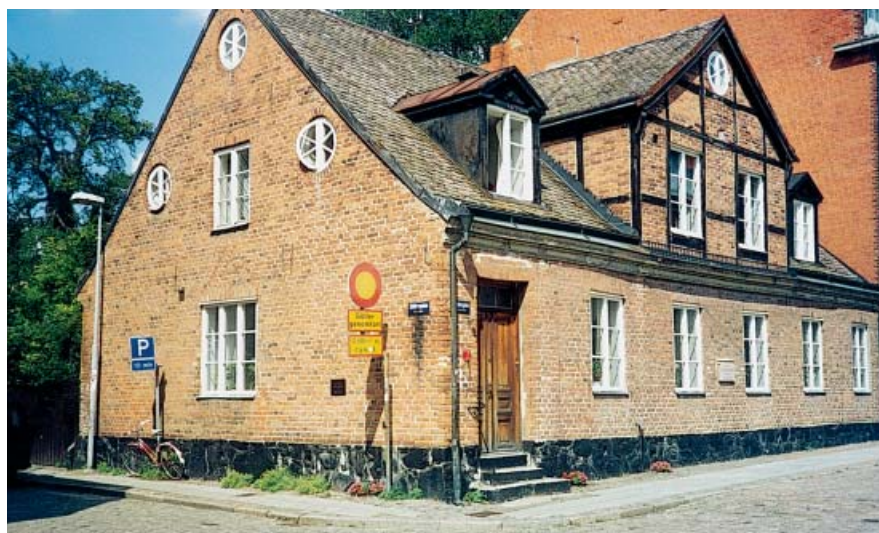
På Grönegatan i Lund skrev Strindberg »av sig« ett års paranoia vanföreställningar i »Inferno«, på franska.

der de medicinska studierna 25 år tidigare. Förutom att försöka framställa guld vill han bevisa att jod, fosfor och svavel inte äro enkla ämnen, utan kol-föreningar. Svavel anser han vare ett fossilt harts enligt formeln \text{CH}_4 : \text{O} = \text{CH}_3 : \text{HO} = \text{CH}_2 : \text{H}_2\text{O} . Dessutom anser han att det kväve som finns i luften är väsensskilt från kvävet i kväveföreningar. Strindberg lyckas även få tillgång till laboratorium på Sorbonne. Att professorn där kallar honom okunnig bekymrar honom föga då han får stöd av andra alkemister.