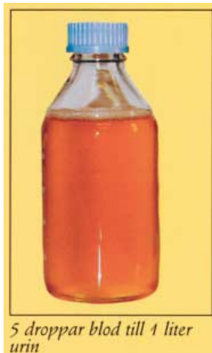
5 droppar blod till 1 liter urin