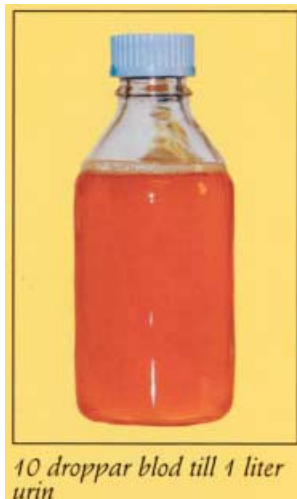
10 droppar blod till 1 liter urin