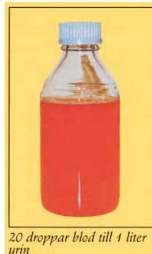
20 droppar blod till 1 liter urin

Det behövs inte många droppar blod för att urinens färg skall ändras märkbart.