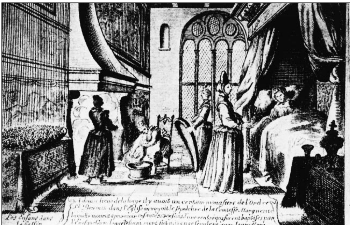
Fransk 1600-talsgravyr som avbildar den märkliga mångbörden i Loosduinen.

framfött en druvbörd eller mola hydatisdosa och därefter själv avlidit av den efterföljande blödningen. De många blå-sorna i denna druvbörd skulle ha symboliserat de 365 barnen. I flera senare översiktsartiklar över trofoblasttumörer har grevinnan Margareta av Henneberg med vördnad refererats som ett av de första kända fallen av denna typ av neoplasi.