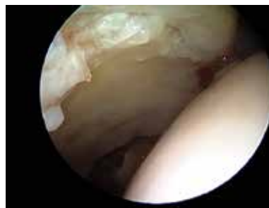
Figur 6. Broskskador i anterolaterala acetabulum sekundärt till inklämning visualiserade vid höftledsartroskopi.