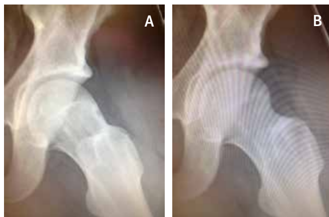
Figur 4. Cam-förändring ses bäst på en specialprojektion av höften som tas med höftleden i en lätt flexion och utåtrotation; A röntgenbild före operation, B röntgenbild efter operation.

Pålagringar på lårbenshalsen benämns cam och pålagringar på kanten till ledhålan (acetabulum) benämns pincer (Figur 1). Labrum acetabuli är den broskring som omsluter ledhållans kant. Labrums normala funktion är att verka som stötdämpare, fördjupa leden samt skapa vakuum. Om det föreligger en