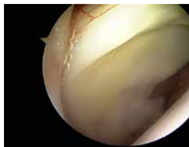
Figur 7. Normal höftled visualiserad vid höftledsartroskopi.