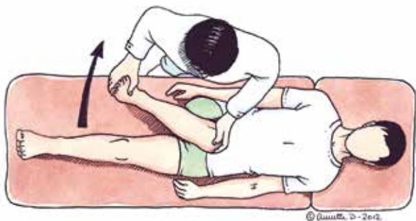
Figur 2 (ovan). FADIR-test: Med patienten på rygg flekteras höften till 90 grader med samtidig inåtrotation.

FABER-test (flexion-abduktion-utåtrotation). Med patienten i ryggläge läggs den aktuella sidans fot proximalt om patella på det motsatta knät, det vill säga »figure-of-four«-