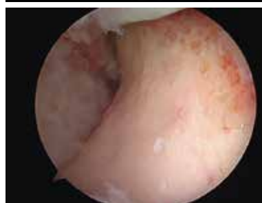
Figur 8. Lårbenshalsen efter resektion av cam-förändring visualiserad vid höftledsartroskopi.

icke-sfärisk form av ledhuvudet, med påbyggnader på lårbenshalsen eller en framträdande kant på ledhålan, kan kompression uppstå på labrum-broskkomplexet även under normal rörelse av höftleden [12]. Om patienten belastar i höftens ytterlägen som i vissa idrotter, uppstår lättare skador på brosk eller labrum, som i sin tur kan ge upphov till smärta (Figur 5-7).