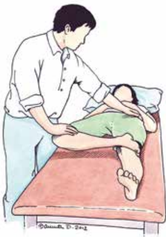
Figur 3 (t v). FABER-test: Med patienten i ryggläge läggs den aktuella sidans fot proximalt om patella på det motsatta knät, det vill säga »figure-of-four«-läge.

läge (Figur 3). Notera avståndet från det aktuella knät ner till britsen i rörelsens ytterläge. Om nedsatt rörlighet föreligger med smärta och patientens symtom framkallas i ytterläget kan detta tala för inklämning. Jämför alltid rörelseomfånget med den motsatta sidan.